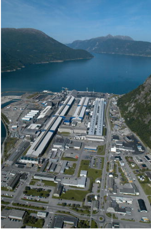
Hydro Aluminium, Sunndalsøra

Trzy miasta Ålesund, Molde i Kristiansund są naturalnymi komercyjnymi i usługowymi centrami w swoich dystryktach. Dodatkowo oprócz miast, jest kilka miasteczek o dużym znaczeniu dla osadnictwa okręgu, zwłaszcza w Sunnmøre. Ørsta i Volda, Stranda, Ulsteinvik i Brattvåg są przykładami dobrze rozwiniętych miasteczek. Åndalsnes, Sunndalsøra i Surnadal pełnią podobne funkcje w Romsdal i Nordmøre.