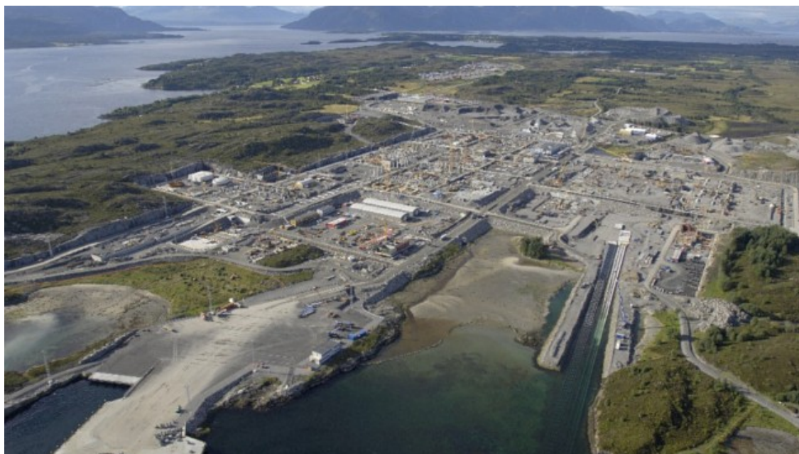
Ormen Lange gas field, Aukra

Z 240,000 mieszkańców jedna trzecia populacji mieszka w trzech miastach Ålesund, Molde i Kristiansund – po jednym mieście w każdej z trzech części okręgu - Sunnmøre, Romsdal i Nordmøre.